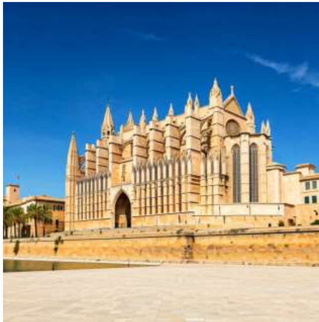
Palma de Mallorca:

Catedral de Mallorca: มหาวิหารปาล์มา เด มาจอร์กา สถาปัตยกรรมโกธิคที่สวยงามตระการตา ภายในมีกระจกสีสวยงามและโคมไฟระย้าขนาดใหญ่