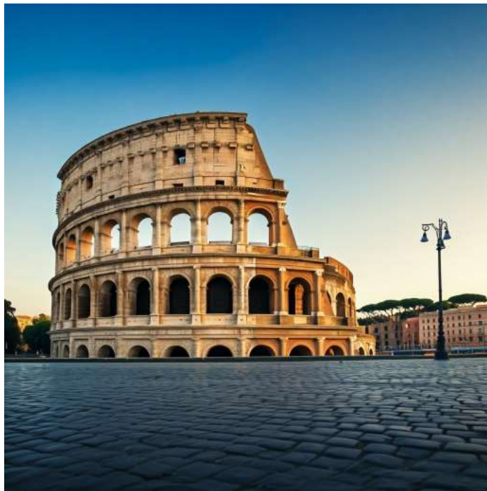
โคลอสเซียม กรุงโรม เริ่มสร้างขึ้นในสมัย จักรพรรดิเวสเปเซียนแห่งจักรวรรดิโรมัน

ซีวีตาเวกเกีย (Civitavecchia) เมืองท่าสำคัญของอิตาลี ตั้งอยู่บนชายฝั่งทะเลดิเรเนียน ใกล้กรุงโรม ด้วยความเป็นเมืองท่าที่คึกคัก ทำให้ซีวีตาเวกเกียมีเสน่ห์ที่ผสมผสานระหว่างความเก่าแก่ของอาคารสถาปัตยกรรม และความทันสมัยของท่าเรือ