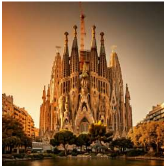
Sagrada Família barcelona spain

มหาวิหารซากราดาแฟมิลี (Sagrada Família): สัญลักษณ์ของบาร์เซโลนาและผลงานชิ้นเอกของเกาดีที่ยังสร้างไม่เสร็จ แต่ก็สวยงามตระการตาด้วยสถาปัตยกรรมที่แปลกตาและรายละเอียดที่ประณีต