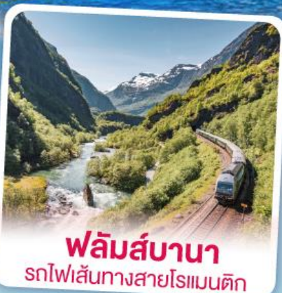
พลิမ်ส์บานา รถไฟเส้นทางสายโรแมนติก