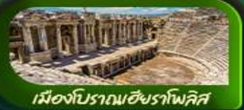
เมืองโบราณเฮียราโพลิส

อิสตันบูล ปามุกคาเล คัปปาโดเกีย ERCIYES MOUNTAIN SKI