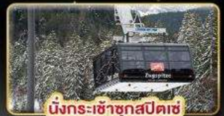
นั่งกระเช้าชุกสปีตซ์