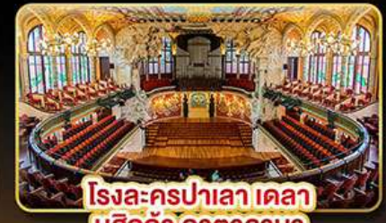
โรงละครปาเลา เดลา มูสิกา คาคาลานา