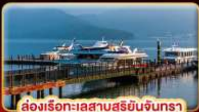
ล่องเรือทะเลสาบสุริยขึ้นจินกรา

บิ๊นดั้ม STREET FOOD แบบจุใจ ขอความรักวัดแดงชาแนล