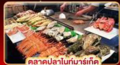
ตลาดปลาไถ่กั๋นมาร์เก็ต