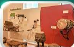
Museum of Folk Instrument