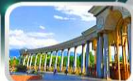
1st President Park