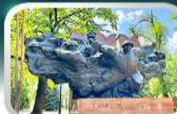
Panfilov Guardsmen Park