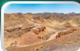
ชารินแกรนด์แคนยอน