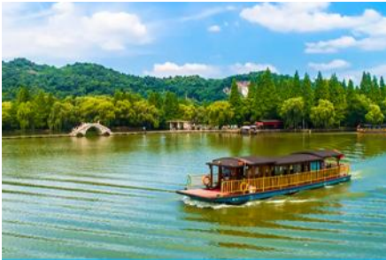
ล่องเรือทะเลสาบเจียนหู