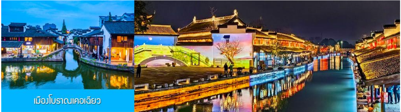
เมืองโบราณเคอเจียว