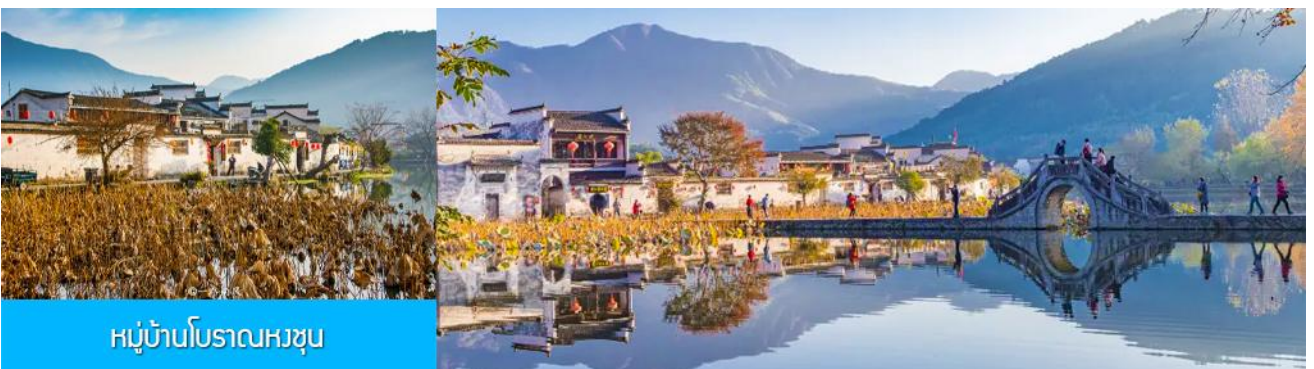
หมู่บ้านโบราณหงซุน

พักที่ โรงแรม QISHUHU HOTEL OR ZHONGCHENG SHANZHUANG 4* หรือเทียบเท่าในเขตอุทยานหวงซาน