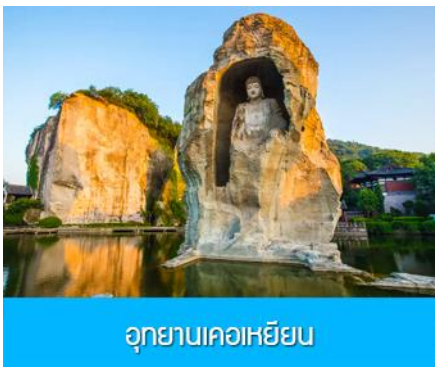
อุทยานเคอเหยียน

พักที่ โรงแรม KAIYUAN MINGTING HOTEL 4* หรือเทียบเท่าในเมืองเส้าชิง