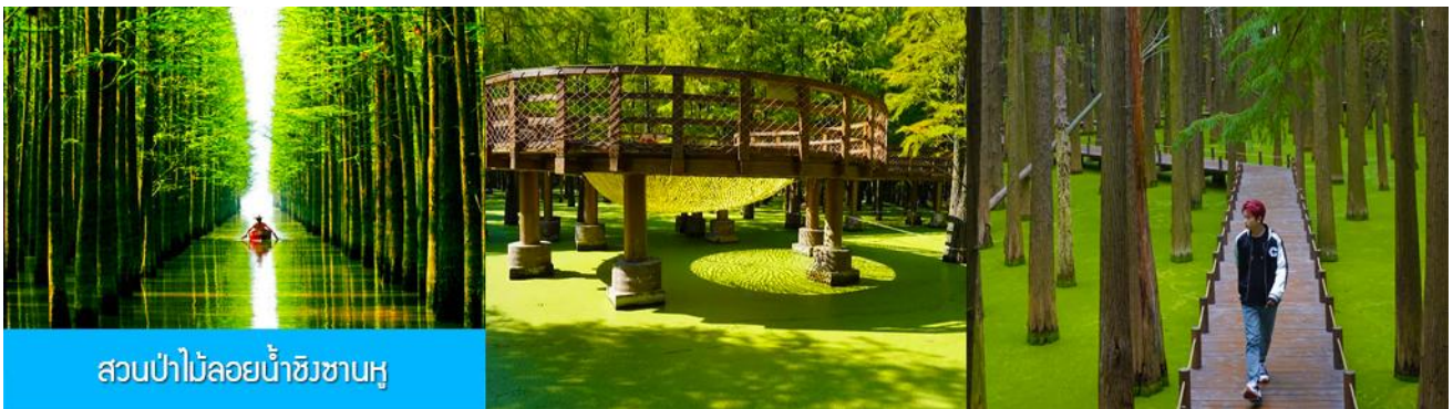
สวนป่าไผ่ลอยน้ำชิงชานหู