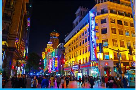
ถนนคนเดินหนานจิงลุ่

หลังอาหารนำท่านเดินทางสู่ นครเซี่ยงไฮ้ 上海 (ระยะทาง 210 กม. ใช้เวลาเดินทางราว 3 ชั่วโมง)