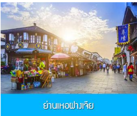
ย่านเหอฝางเจีย

อิสระอาหารมื้อกลางวัน ท่านสามารถเลือกชิม STREET FOOD ขึ้นชื่อมากมายในย่านเหอฝางเจีย