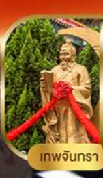
เทพจันทร

พิเศษฟรี! ลงห้องลับหวังต้าเซียน รวมกระเช้าฮ่องกง