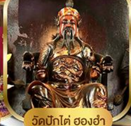
วัดบิกโต๋ ฮองอ่า