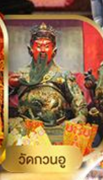
วัดกวนอู