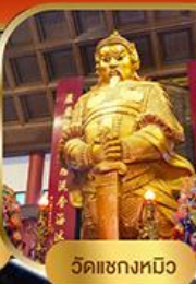
วัดเข่งหมิว