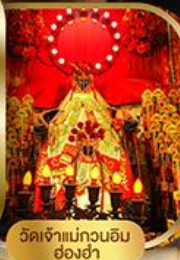
วัดเจ้าแม่กวนอิม ฮองอ่า