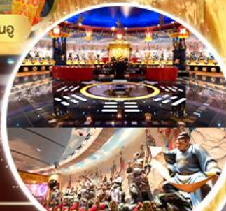
ห้องลับ วัดหวังต้าเซียน

ทริคินี่ พิกย่านแหล่ง Shopping Tsim Sha Tsui , Mong Kok , Jordan