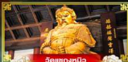
วัดเข่งทมิฬ