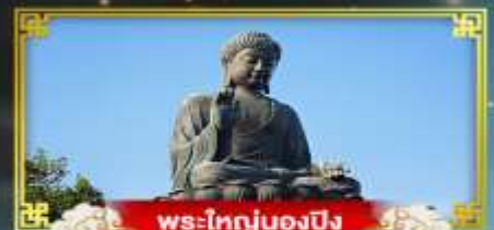
พระใหญ่ของปิง