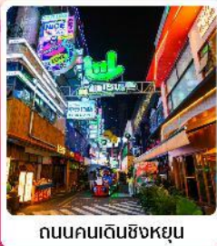
ถนนคนเดินซิงหยุน

• โฮเทล ส่วนชาคุระผิงปา หนึ่งในสถานที่ชมดอกชาคุระที่ใหญ่ที่สุดในโลก น้ำตกสวยระดับ 5A น้ำตกหวงกั๋วซู่ หมู่บ้านจีนโบราณ จูเจียงจ้าย