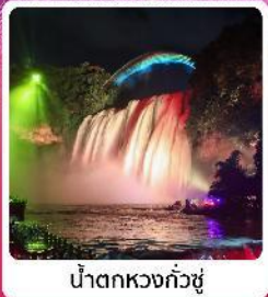
น้ำตกหวงกั๋วซู่