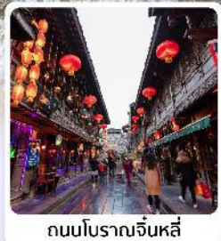
ถนนโบราณจีนหลี่