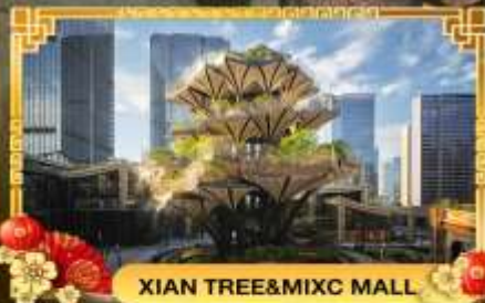
XIAN TREE&MIXC MALL