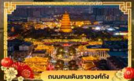
ถนนคนเดินราชวงศ์ถัง