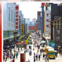
ช้อปปิ้งถนนคนเดินซุนชี่ลู่