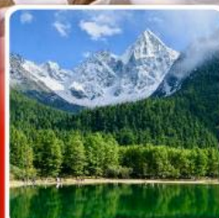
อุทยานπίงเิงโกว