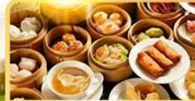
อาหารกวางตุ้ง