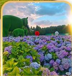
ดอกไม้ตามฤดูกาล