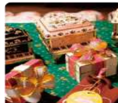
กล่องดนตรี MUSIC BOX