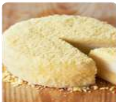
ร้าน LeTAO ร้านมีผลิตภัณฑ์อร่อย ด้วยบรรยากาศในร้านตกแต่งสวยงามไว้ที่แสนอบอุ่น อีกทั้งด้วยด้วยเมนูหลากหลายแบบมีให้เลือก