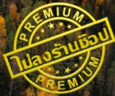
หาดห้าสี