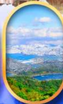
ทะเลสาบมิกะตะ