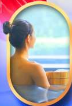
พักโรงแรมออนเซ็น