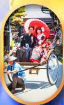
ศาลเจ้าจิ้งจอก