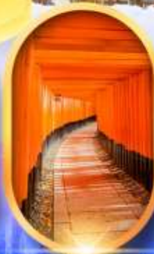
เมืองเก่าทาคายาม่า