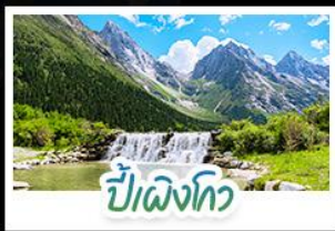
ปี่เฉิงโกว