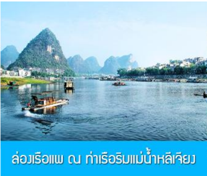
ล่องเรือแพ ณ ท่าเรือริมแม่น้ำหลีเจียง