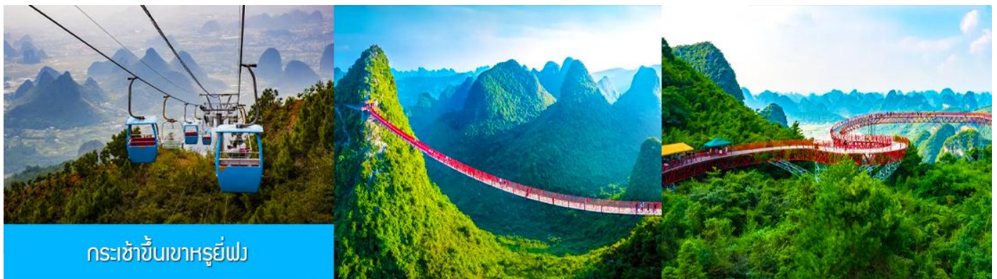
กระเช้าขึ้นเขาหฺรูยี่ฟง

อัตราค่าบริการสำหรับโปรแกรมเสริมการแสดงชุด The Impression of Liu san jie ท่านละ 350 หยวน ระยะเวลาที่ใช้ในการเที่ยวชมการแสดง ประมาณ 2 ชั่วโมงครึ่ง รวมเวลาเดินทางไป กลับ ค่าบริการรวม ค่าบัตรเข้าชม ค่ารถรับ ส่ง และค่าน้ำดื่มของไกด์ท้องถิ่น ที่พักที่ YANGSHUO ELITE HOTEL ระดับ 4 ดาวท้องถิ่นหรือเทียบเท่าใน เมืองหยางชัว