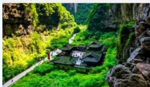
อุทยานแห่งชาติหลุมฟ้า