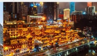
หงหยาดัง(ชมไฟยามค่ำคืน)

*ทางบริษัทฯ ขอสงวนสิทธิ์ในการสลับโปรแกรมทัวร์ตามความเหมาะสมขึ้นอยู่กับสถานการณ์หน้างาน โดยคำนึงถึงผลประโยชน์ของลูกค้าเป็นสำคัญ