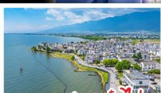
ทะเลสาบเอ๋อไห่