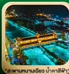
“สะพานหนานเฉียว น้ำคาสีฟ้า”