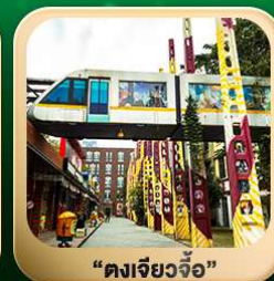
“ดงเจียวจื่อ”

วันเดินทาง 4 วัน | 3 คืน มี.ค. - มิ.ย. 2569