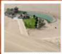
เมืองกรวยหิ่งฮาชาน