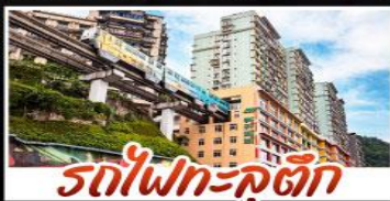
รถไฟฟ้า-คูตัก