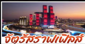
จัตุรัสราฟเฟิลส์