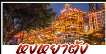
แสงอาคารต่าง

สัมผัสประสบการณ์เที่ยวจีนแบบเต็มอิ่ม ทั้งความล้ำสมัยของมหานครฉงชิ่ง และความงดงามตระการตาของธรรมชาติที่จุหล่ง ทุกการเดินทางเต็มไปด้วยความสะดวกสบายและคุ้มค่าที่สุดราคา!