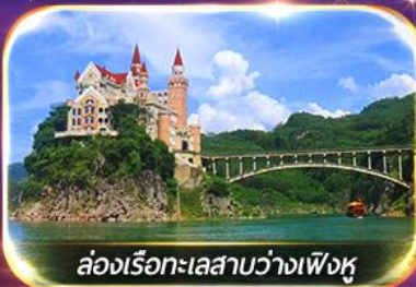
ล่องเรือทะเลสาบว่างเฟิงหู