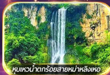
หุบเขาน้ำตกร้อยสายหม่าหลิงเหอ

ชมวิถีชีวิตหมู่บ้านปู้อี้ยามค่ำคืน, ล่องเรือทะเลสาบว่างเฟิงหู ชมสวนดอกไม้ตามฤดูกาล, ซุปบึงจู่ใจถนนคนเดิน