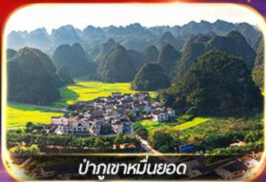
ป่าภูเขาหมื่นยอด