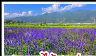
สวนดอกไม้ฮาวามู่ฉาง