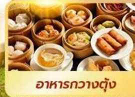
อาหารกวางตุ้ง