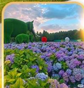
ดอกไม้ตามฤดูกาล