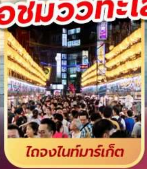
ไถจงไนท์มาร์เก็ต