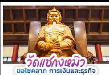
วัดแห่งกวงเมียว ขอโชคลาภ การเงินและธุรกิจ