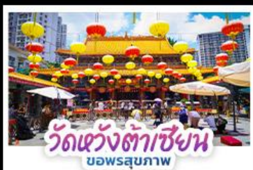
วัดแห่งต้าเซียน บอพรสุขภาพ