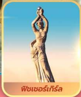
พีชเชอร์เกิร์ล