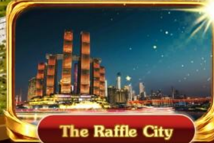
The Raffle City