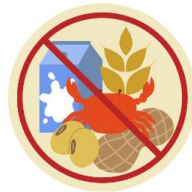
● แพ้อาหาร / อื่นๆโปรดระบุ