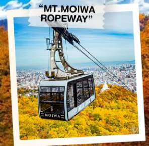
“MT. MOIWA ROPEWAY”