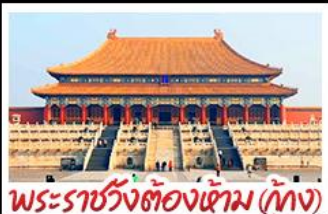
พระราชวังต้องห้าม (ปีกัง)