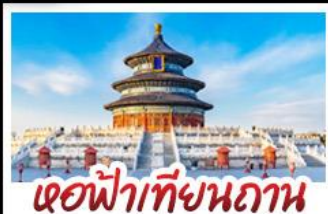
เขื่อนฟ้าเทียนถ่าน