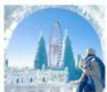
ICE & SNOW FEST.