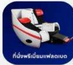
ที่นั่งพรีเมียมแฟลตเบด

บริการอาหารร้อน และ น้ำดื่ม บนเครื่องบิน ขาไป และ ขากลับ