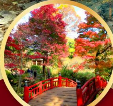
สวนดอกบ๊วยอาคาบิ