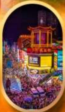
ถนนคนเดินซิงลู่