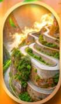
หุบเขาป้ายจ้าง