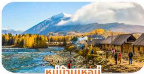
หมู่บ้านเหม่มี