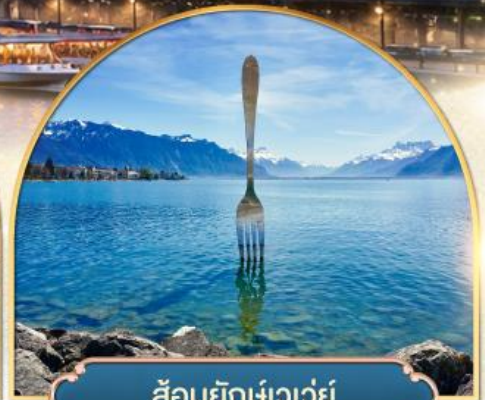
ล้อมยีก่เว่วย