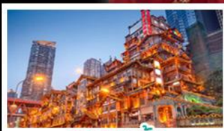
ตงเฉยตัง