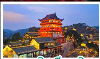
ตงเฉยหนเทียนหนเจิง