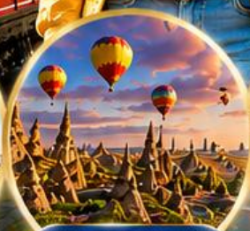
เมืองคปปาโดเกีย Cappadocia