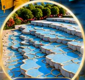
ปามุกคาล์ Pamukkale