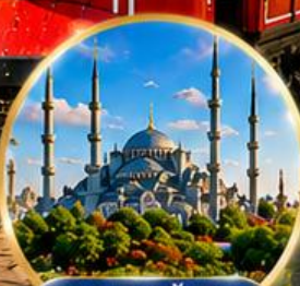
สุเหร่าสีน้ำเงิน Blue Mosque