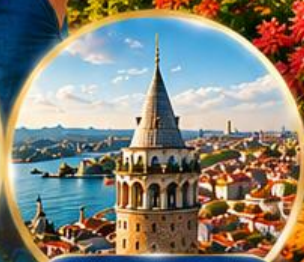
หอคอยกาลาตา Galata Tower