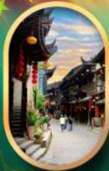
เมืองโบราณฟูหลงเจิน