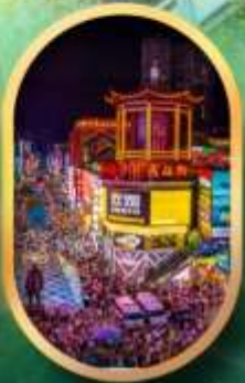
ถนนคนเดินซิงสือ