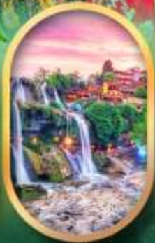
ฟูหลงเจินน้ำตก