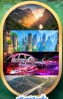
ฟรีคีย์เลือกซื้อ Option เสริม