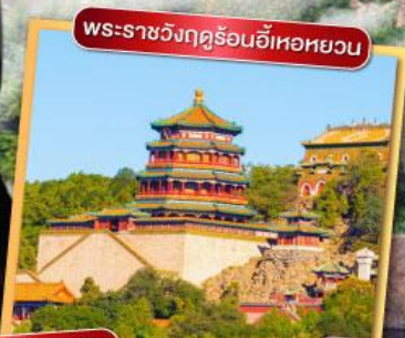
พระราชวังฤดูร้อนอี้เหอหยวน